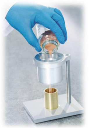
図 1.ホールフローメータ

粉末は固相でありながら、その形状から一定以上の力が加わると液相のように流動する性質をもち、この流れやすさを示すものを流動性と言います。評価方法の一つに、ホールフロー/カーニーフローがあります。穴の開いた漏斗に規定質量の粉末を入れ自重で落下しきる時間を測り、時間が短い方が流動性がよいされます 1) 。なお、カーニーフローはホールフローで粉末が自由落下しない(流動性が悪い)時に行う評価方法で、漏斗の穴が大きくなっています。(規定体積の粉末を入れ、流動性を確認する試験方法、ASTM B855 もありますが、弊社では扱っていないため、割愛させていただきます。)