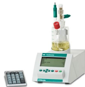
図 2.カールフィッシャー水分計

カールフィッシャー水分計は粉末に付着した水分量を ppm オーダーで測定が可能です。粒子径は、自動画像解析装置とレーザ回折式粒度分布測定装置で測定可能です。それぞれの特徴として自動画像解析装置は面積円相当径測定し、レーザ回折式粒度分布測定装置は体積球相当径で測定を行います。粒子形状は、自動画像解析装置で面積円形度やアスペクト比、周囲長包絡度、面積包絡度を自動で測定が可能です。